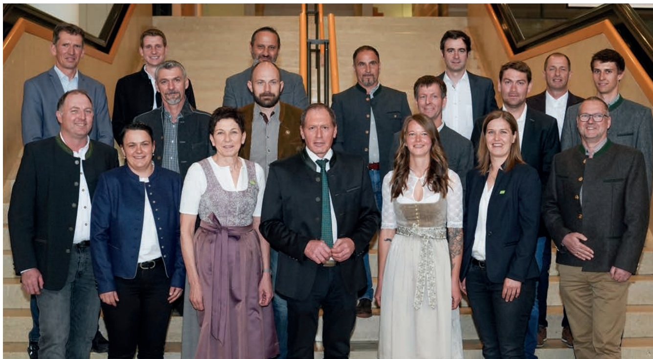
Die neugebildete Vollversammlung der LK Vorarlberg mit den Funktionären beider Sektionen nach der Angelobung.