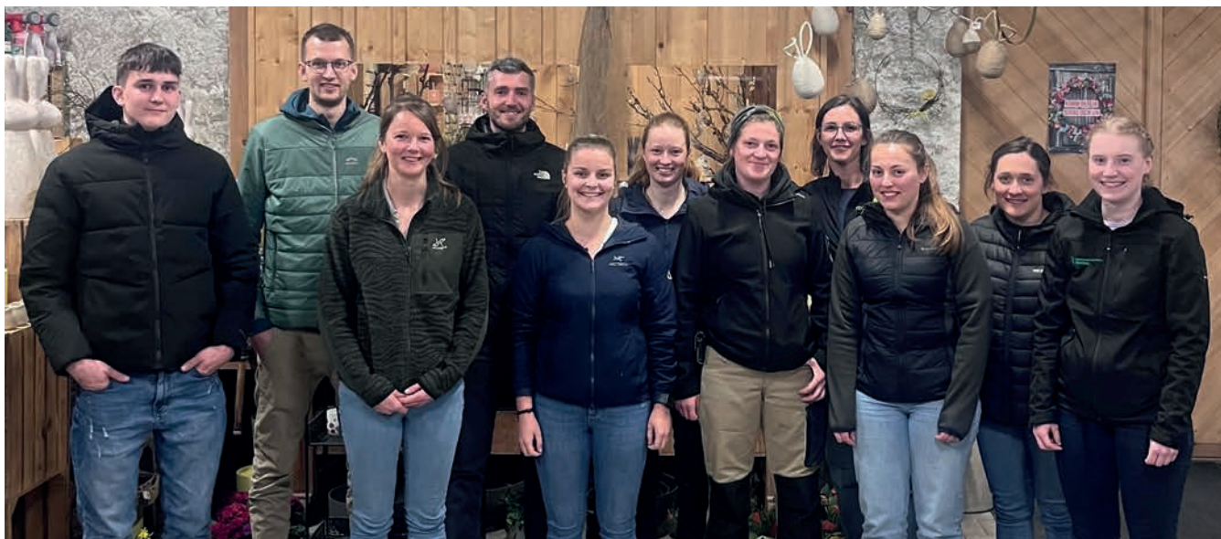
Gute Stimmung bei den Mitgliedern und Ehrengästen der Jungen Gärtner und Floristen Vorarlberg.

Die Jahreshauptversammlung der Jungen Gärtner und Floristen Vorarlberg führte Mitglieder und Ehrengäste am 13. März nach Andelsbuch in die Gärtnerei reGREENa.