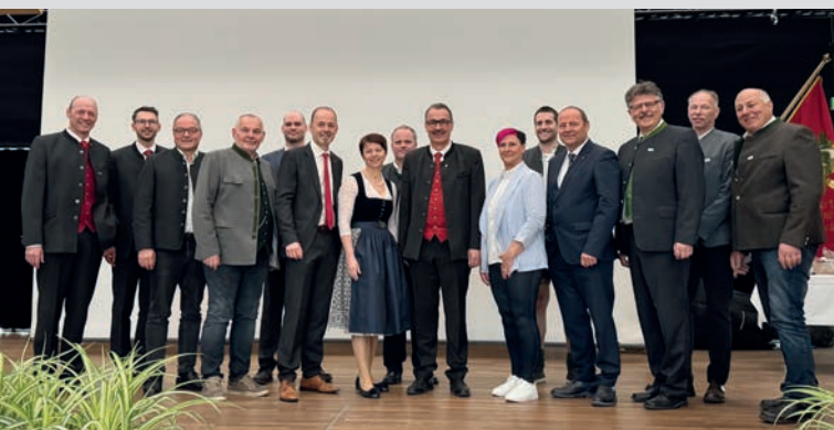
Ehrengäste aus Tirol und den Bundesländern nahmen an der Versammlung teil.

Am Montag, den 13. April, fand in Absam die 78. Vollversammlung des Tiroler Land- und Forstarbeiterbundes statt. Auf der Tagesordnung standen auch ein Impulsvortrag zum Thema Kommunikation und Interessenvertretung.