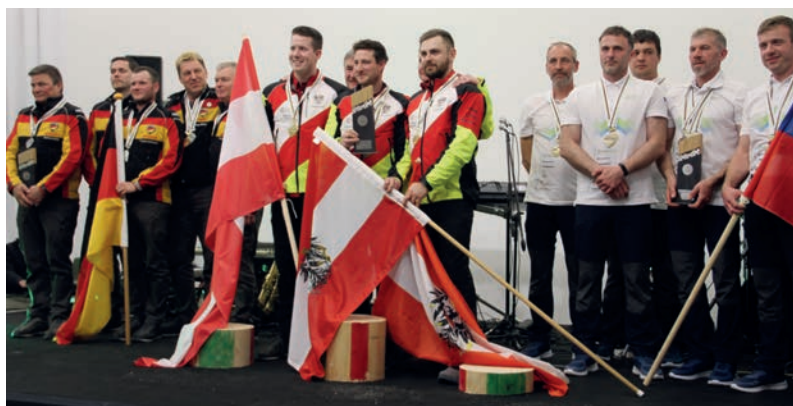
Bereits zum siebten Mal konnte Team Österreich die Mannschaftswertung für sich entscheiden. Der zweite Platz ging an Deutschland gefolgt von Slowenien.